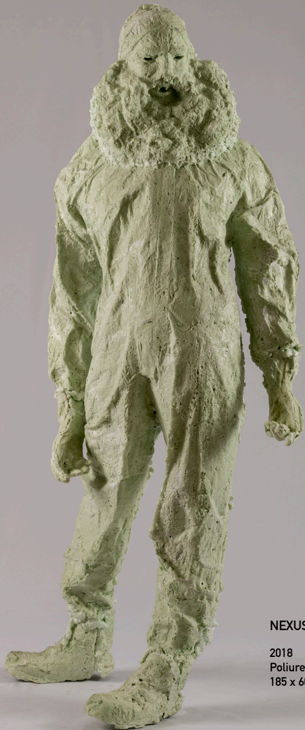
NEXUS KOMPOZÍCIÓ (BIG BOY)